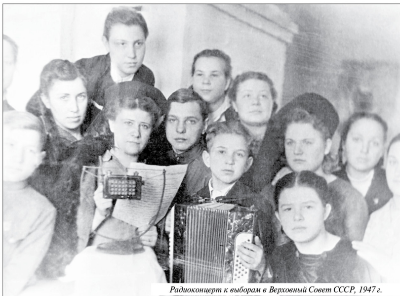
Радиоконцерт к выборам в Верховный Совет СССР, 1947 г.