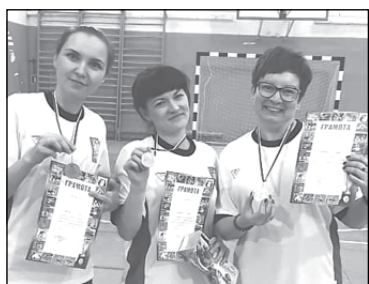
Тем не менее, команды-участницы турнира выступили достойно. Зрители стали свидетелями интересных сетов и захватывающей

Бадминтон – игра, знакомая многим с детства. Но, как оказалось, условия игры не так просты.