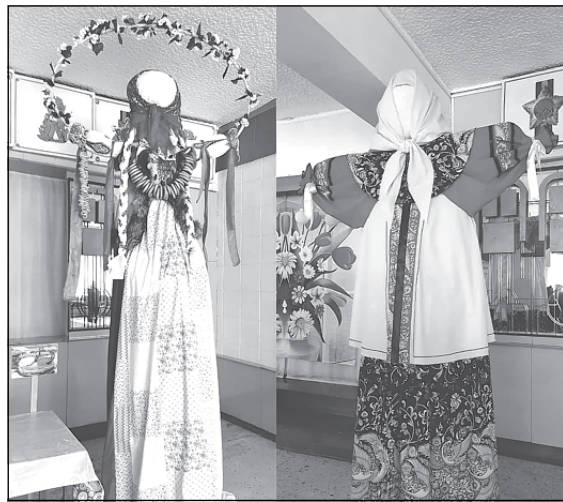
(на фото слева) и Дом детского творчества с изделием «Масленица-краса». Все участники конкурса были награждены призами за участие и победу в различных номинациях.

По итогам муниципального конкурса I место присудили Дому культуры «Сударыня Масленица» (на фото справа), II место – у детского сада № 4 «Солнышко» «Масленица Авдотья Изотьевна», 3 место заняли Детско-юношеская спортивная школа с куклой «Масленица-краса, длинная коса»