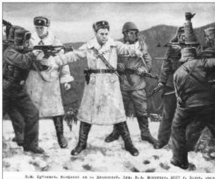
Л.М. Буйневич. Фотограф из архива. Тува. В.А. Морозов, 2017 г. Санкт-Петербург

7 марта 1969 года в городе Имане, ныне город Дальнереченск, хоронили павших в бою на острове Даманский начальника 2-й пограничной заставы старшего лейтенанта Ивана