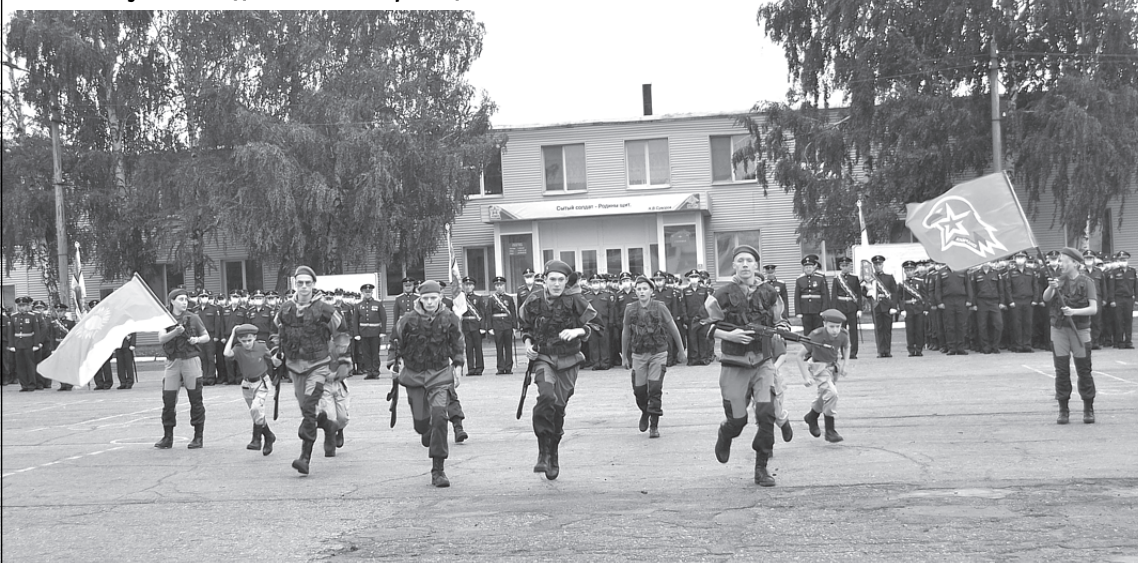
Праздничную атмосферу мероприятия своим выступлением дополнили юнармейцы

ресные концертные номера лучших творческих коллективов.