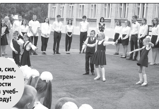
Успехов, сил, целеустремлённости в новом учебном году!