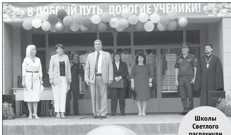
Школы Светлого распахнули двери для 1270 учеников