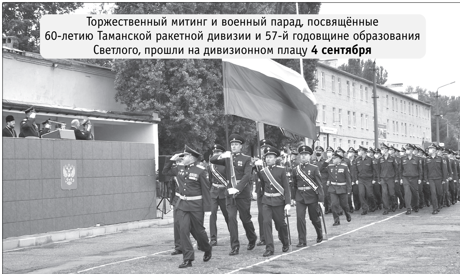
Торжественный митинг и военный парад, посвящённые 60-летию Таманской ракетной дивизии и 57-й годовщине образования Светлого, прошли на дивизионном плацу 4 сентября

В этот день в зрительном зале Дома культуры состоялось торжественное мероприятие, посвящённое юбилею соединения. Слова поздравлений с юбилеем дивизии и 57-й годовщиной образования городка прозвучали из уст коман-