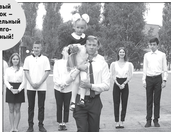
Первый звонок – волнительный и долгожданный!