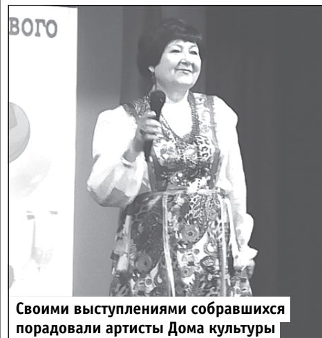
Своими выступлениями собравшихся порадовали артисты Дома культуры

Уважаемые жители Светлого! Если ваше внимание привлекут подозрительные предметы, лица или обстоятельства, обращайтесь в дежурные службы (круглосуточно): ФСБ – 4-32-54, 3-10; в/ч 89553 – 4-33-21; МО МВД – 4-30-87, 02; ЕДДС – 4-32-00, 112.