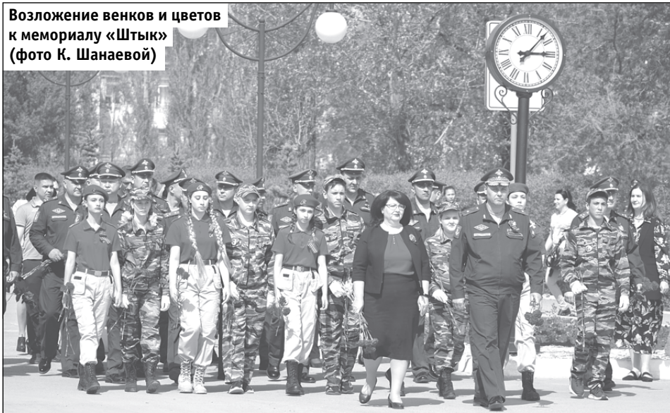
Возложение венков и цветов к мемориалу «Штык»

В преддверии праздника, 7 мая, представители администрации, командования Таманской ракетной дивизии, Муниципального собрания побывали в гостях у тружеников тыла. Гости вручили ветеранам труда цветы, открытки и подарки. Душевным и приятным сюрпризом стал небольшой концерт под окнами: любимые мелодии военных лет прозвучали в исполнении военного духового оркестра.