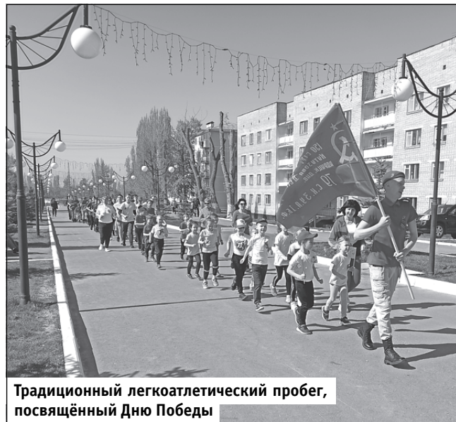
Традиционный легкоатлетический пробег, посвящённый Дню Победы