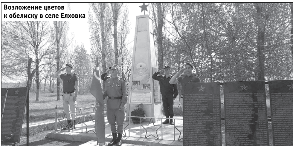
Возложение цветов к обелиску в селе Елховка