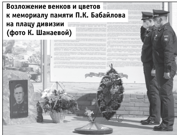
Возложение венков и цветов к мемориалу памяти П.К. Бабайлова на плацу дивизии