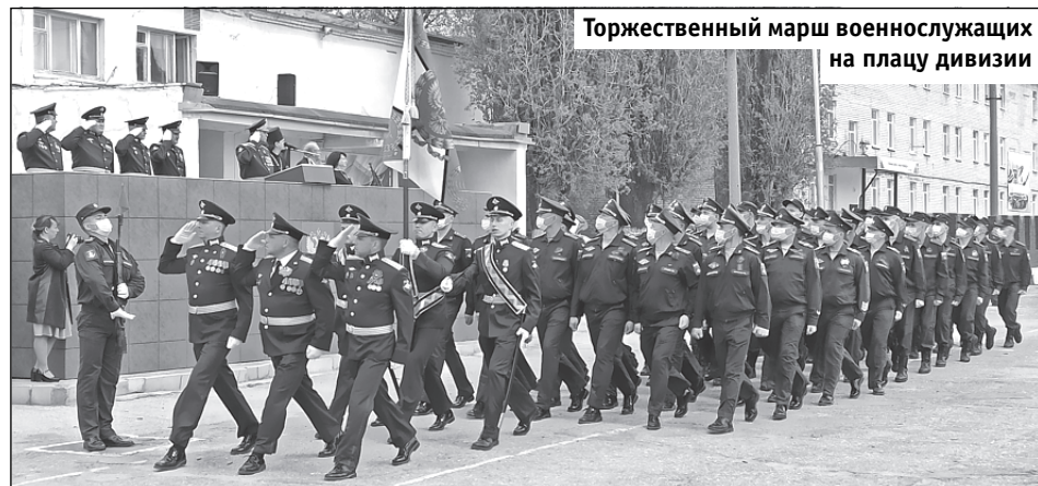
Торжественный марш военнослужащих на плацу дивизии