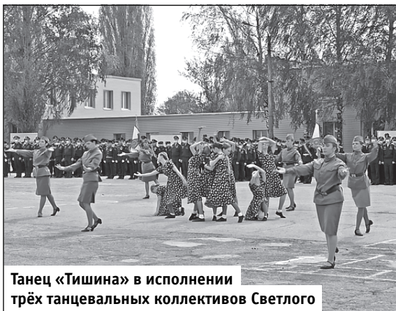
Танец «Тишина» в исполнении трёх танцевальных коллективов Светлого