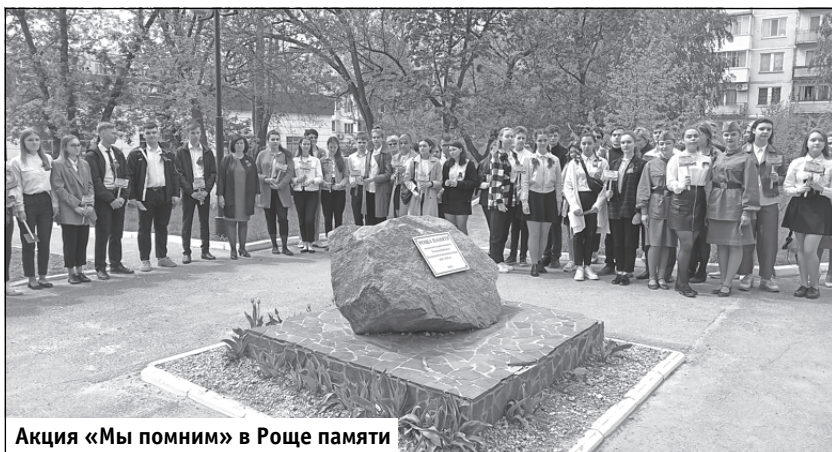
Акция «Мы помним» в Роце памяти