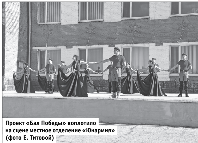
Проект «Бал Победы» воплотило на сцене местное отделение «Юнармия»

Ежегодно в России проходит акция «Свеча памяти», которая призвана почтить память всех, кто ушёл на фронт и не вернулся. В домах зажигаются свечи, символизирующие память о жертве миллионов сограждан в борьбе против фашистской Германии. 9 мая многие жители Светлого присоединились к этой акции и почтили память всех солдат и мирных жителей, которые стали жертвами нацистов.