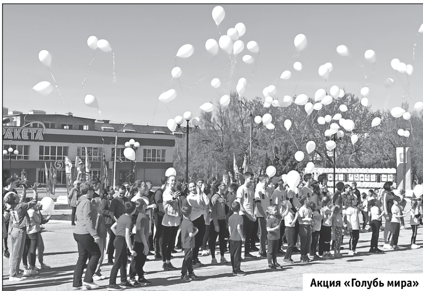
Акция «Голубь мира»