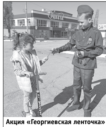
Акция «Георгиевская ленточка»