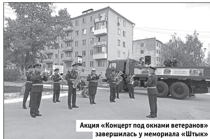
Акция «Концерт под окнами ветеранов» завершилась у мемориала «Штык»