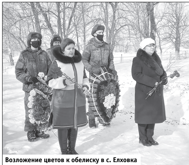
Возложение цветов к обелиску в с. Елховка