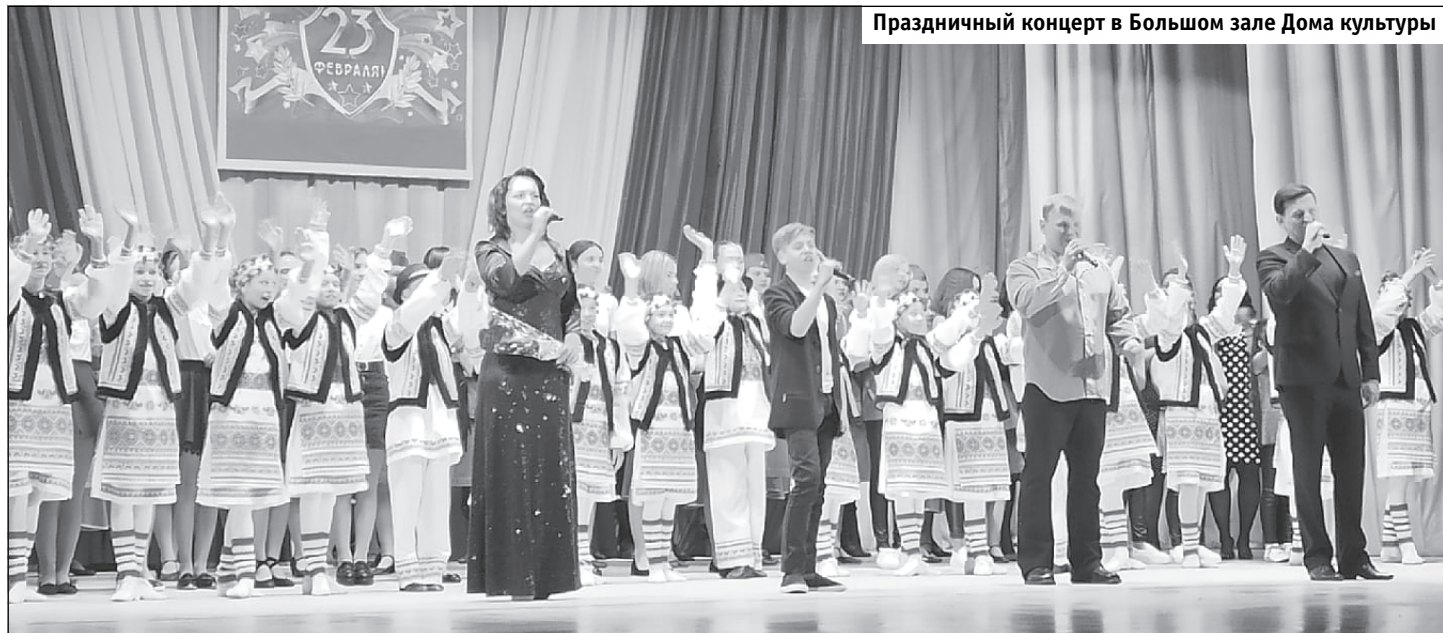
Праздничный концерт в Большом зале Дома культуры

Уважаемые жители Светлого! Если ваше внимание привлекут подозрительные предметы, лица или обстоятельства, обращайтесь в дежурные службы (круглосуточно): ФСБ – 4-32-54, 3-10; в/ч 89553 – 4-33-21; МО МВД – 4-30-87, 02; ЕДДС – 4-32-00, 112.