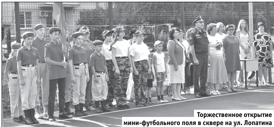
Торжественное открытие мини-футбольного поля в сквере на ул. Лопатина

Ни один государственный праздник в России не обходится без поднятия Государственного флага. У нашего триколора есть свой отдельный праздник, установленный в 1994 году на основании Указа Президента РФ. Ежегодно, 22 августа , в нашей стране отмечается День Государственного флага. В минувшее воскресенье в Светлом прошла череда мероприятий, посвящённых Дню Государственного флага Российской Федерации.