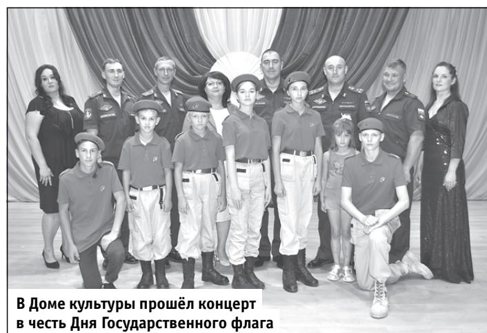
В Доме культуры прошёл концерт в честь Дня Государственного флага