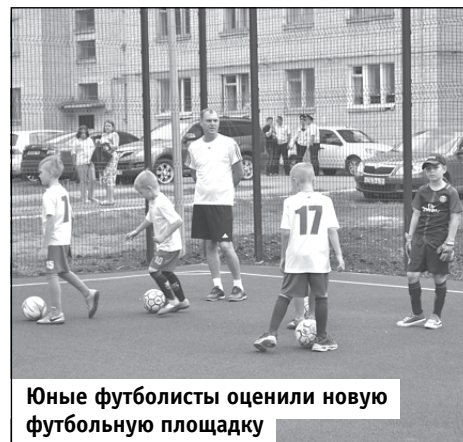
Юные футболисты оценили новую футбольную площадку