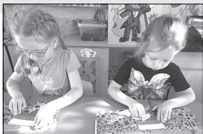
Россия в её символах