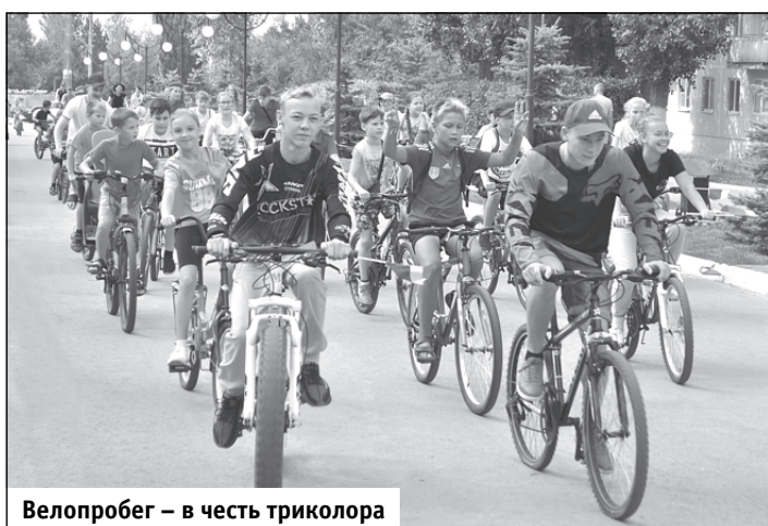
Велопробег – в честь триколора