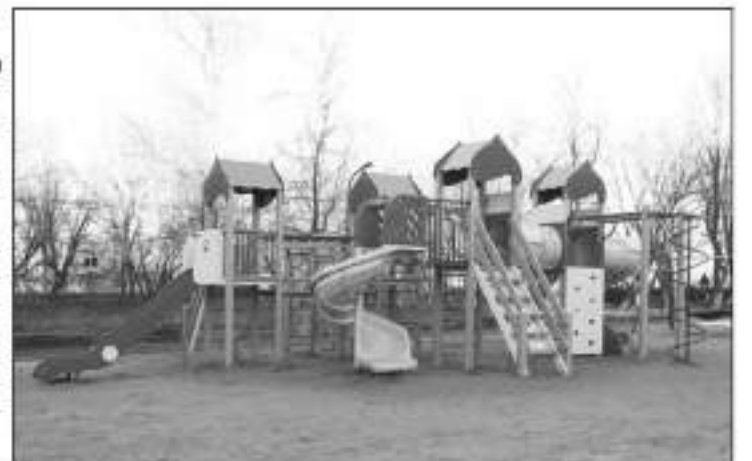
Продолжение на стр. 2

Сначала по просьбам жителей был построен скейт-парк.