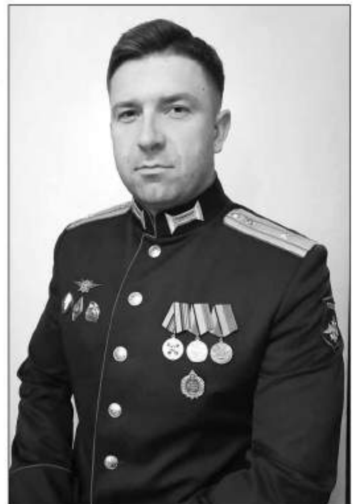
«Мое творчество, которое оценили на конкурсе - лишь малая толика дань памяти Героям Великой Победы».

«Писать о войне очень сложно, но необходимо, ведь ещё до сих пор многое не рассказано о героических и трагических судьбах, о тяжелых днях, которые пережили наши деды и от-