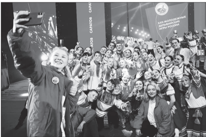
В Саратове завершились XXII молодежные Дельфийские игры России.

В Саратовском государственном цирке имени братьев Никитиных состоялась торжественная церемония закрытия игр и гала-концерт.