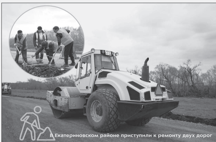
В Екатериновском районе приступили к ремонту двух дорог

Всего в этом году по нацпроекту «Безопасные качественные дороги» планируется привести в нормативное состояние 320 км трасс и 13 мостов и тепловодов.