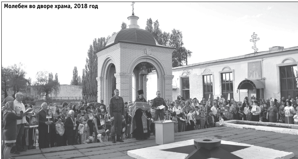
Молебен во дворе храма, 2018 год

В этом году 30 сентября исполняется двадцать лет местному храму во имя Мучениц Веры, Надежды, Любви и матери их Софии.