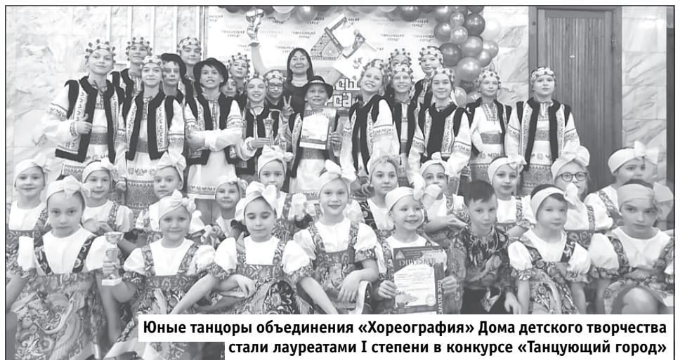
Юные танцоры объединения «Хореография» Дома детского творчества стали лауреатами I степени в конкурсе «Танцующий город»