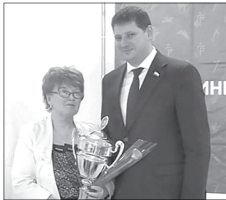
А.В. Абросимов вручил городскому округу ЗАТО Светлый кубок победителя в рейтинге реализации ВФСК «ГТО»

5 марта в Центре бадминтона, построенном в рамках национального проекта «Демография», прошло заседание коллегии министерства молодёжной политики и спорта по вопросу «Об итогах развития отрасли «физическая культура и спорт» на территории Саратовской области в 2020 году и задачах на 2021 год».