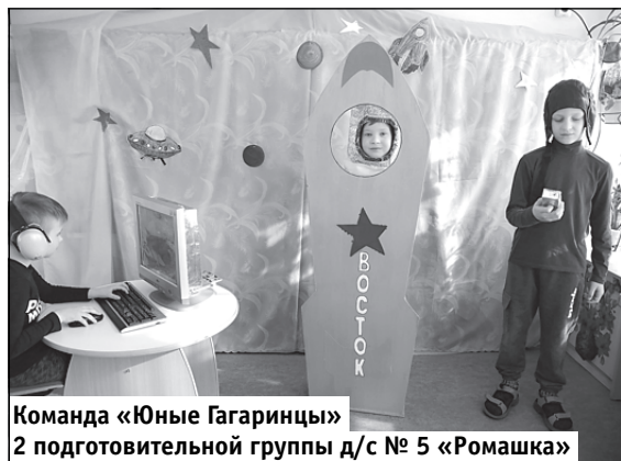
Команда «Юные Гагаринцы» 2 подготовительной группы д/с № 5 «Ромашка»

С 12 марта по 12 апреля кафедра дошкольного и начального образования ГАУ ДПО «СОПРО» проводила региональный марафон «7 шагов к звёздам!», посвящённый 60-летию первого полёта человека в космос. Цель проекта – выявление и вовлечение молодых дарований в исследовательскую и поисковую деятельность в ходе знакомства с историей освоения космоса. В марафоне участвовали воспитанники дошкольных образовательных организаций и обучающиеся начального образования.