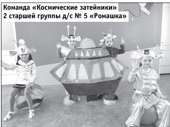
Команда «Космические затейники» 2 старшей группы д/с № 5 «Ромашка»

Для прохождения марафона участникам нужно было выполнить 7 заданий и отправить фотоотчёт о проделанной работе.