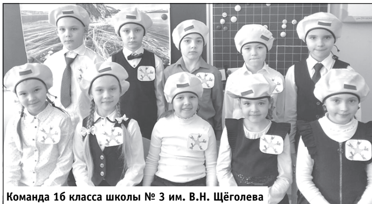
Команда 16 класса школы № 3 им. В.Н. Щёголева