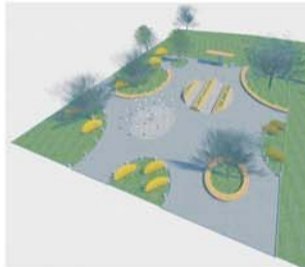
Вид с высоты птичьего полета